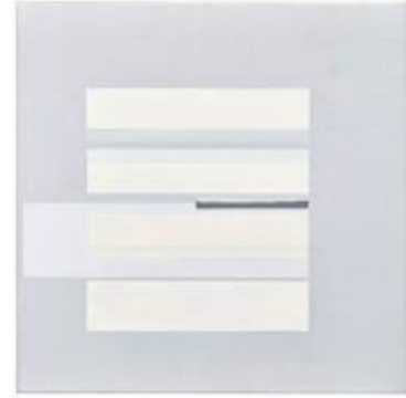
Lot 139 林寿宇《七》 1968 年作 油彩 铝 画布 63 × 64 cm.