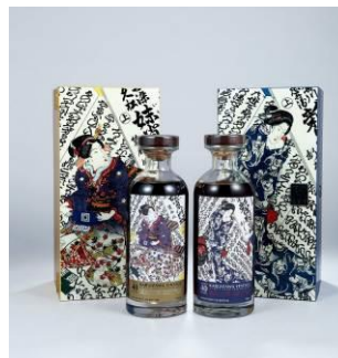
Lot 1413 輕井澤 40 年 - 藝伎 #3260 輕井澤 40 年 - 藝伎 #4560 單一麥芽 雪莉桶 全球限量 392 瓶 單一麥芽 雪莉桶 全球限量 192 瓶 ABV64.5% 700ml 1 bt/瓶 ABV58.8% 700ml 1 bt/瓶