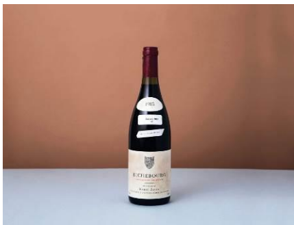
Lot 1075 Domaine Henri Mayer Richebourg 1985 Magnum Cote de Nuits, Burgundy, France 1.5L 1 bottle Capsule broken