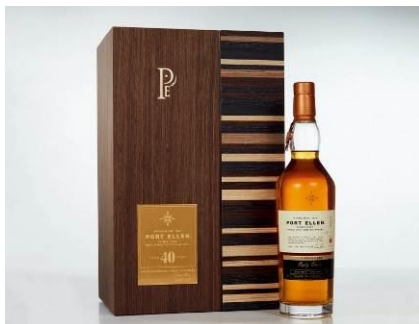
Lot 1286 艾倫港 40 年 單一麥芽 雪莉桶 1978 年入桶 2018 年裝瓶 全球限量 328 瓶 ABV 56.2% 700ml 1bt/瓶